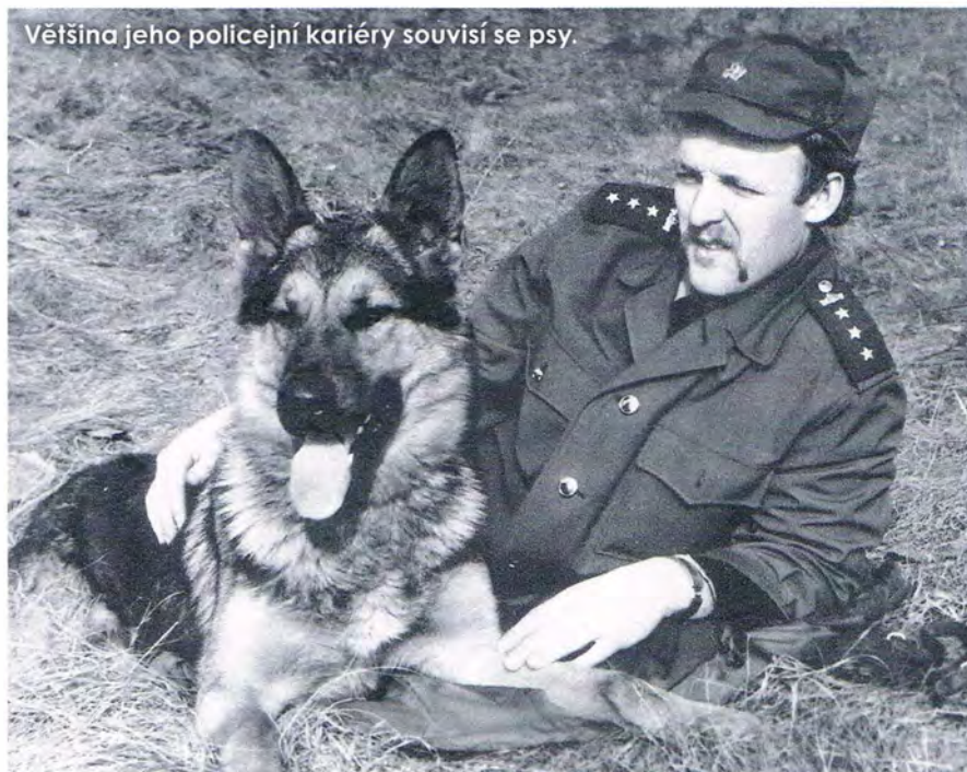
Většina jeho policejní kariéry souvisí se psy.

Olfaktronika – objektivní metoda, která k analýze pachů využívá analytické přístroje.