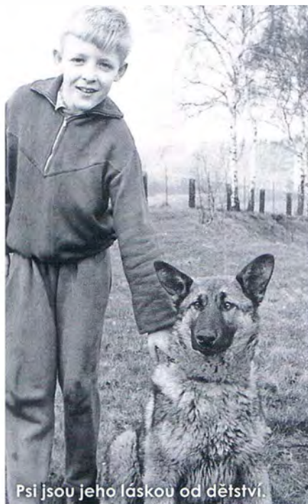
Psi jsou jeho láskou od dětství.

Olfaktorika – metoda sloužící k individuální pachové identifikaci osob, jejímž základním principem je komparace porovnávané pachové stopy s pachovým vzorkem konkrétní porovnávané osoby prostřednictvím speciálně vycvičeného psa (olfaktorický – čichový).